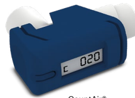
CountAir® PZN 16350191

Der CountAir® ist ein Medizinprodukt. Speziell entwickelt für alle COPD- und Asthmapatienten, die ein Dosieraerosol ohne eingebauten Zähler verwenden.